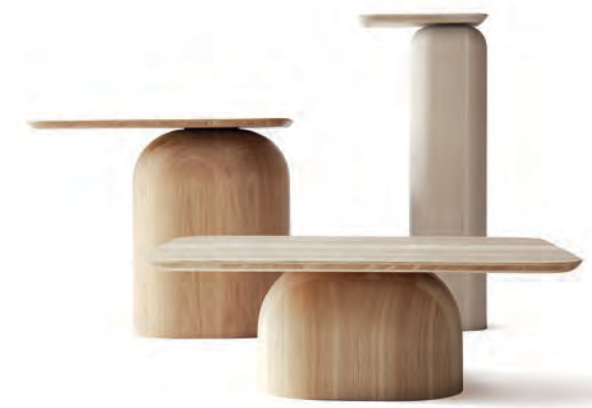
Tisch-Familie „April“ für Nikari (2012). The „April“ tables for Nikari.

Häberli: Dass ich die junge Schweizer Designszene maßgeblich beeinflussen kann. Dass ich meine Erfahrungen und mein Wis-