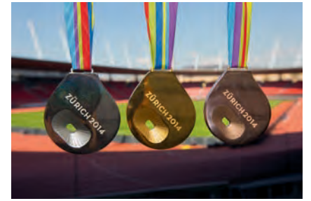
Für die Leichtathletik-Europameisterschaft 2014 in Zürich entwarf Häberli die Medaillen. For the European Athletics Championships in Zurich in 2014, Häberli designed the medals.

technical developments have on your work?