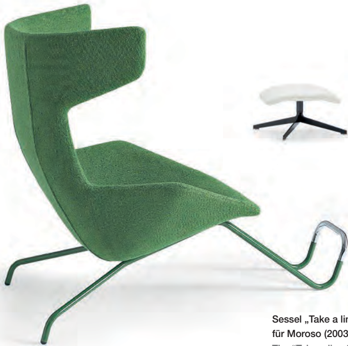
Sessel „Take a line for a walk“ für Moroso (2003). The “Take a line for a walk” chair for Moroso.