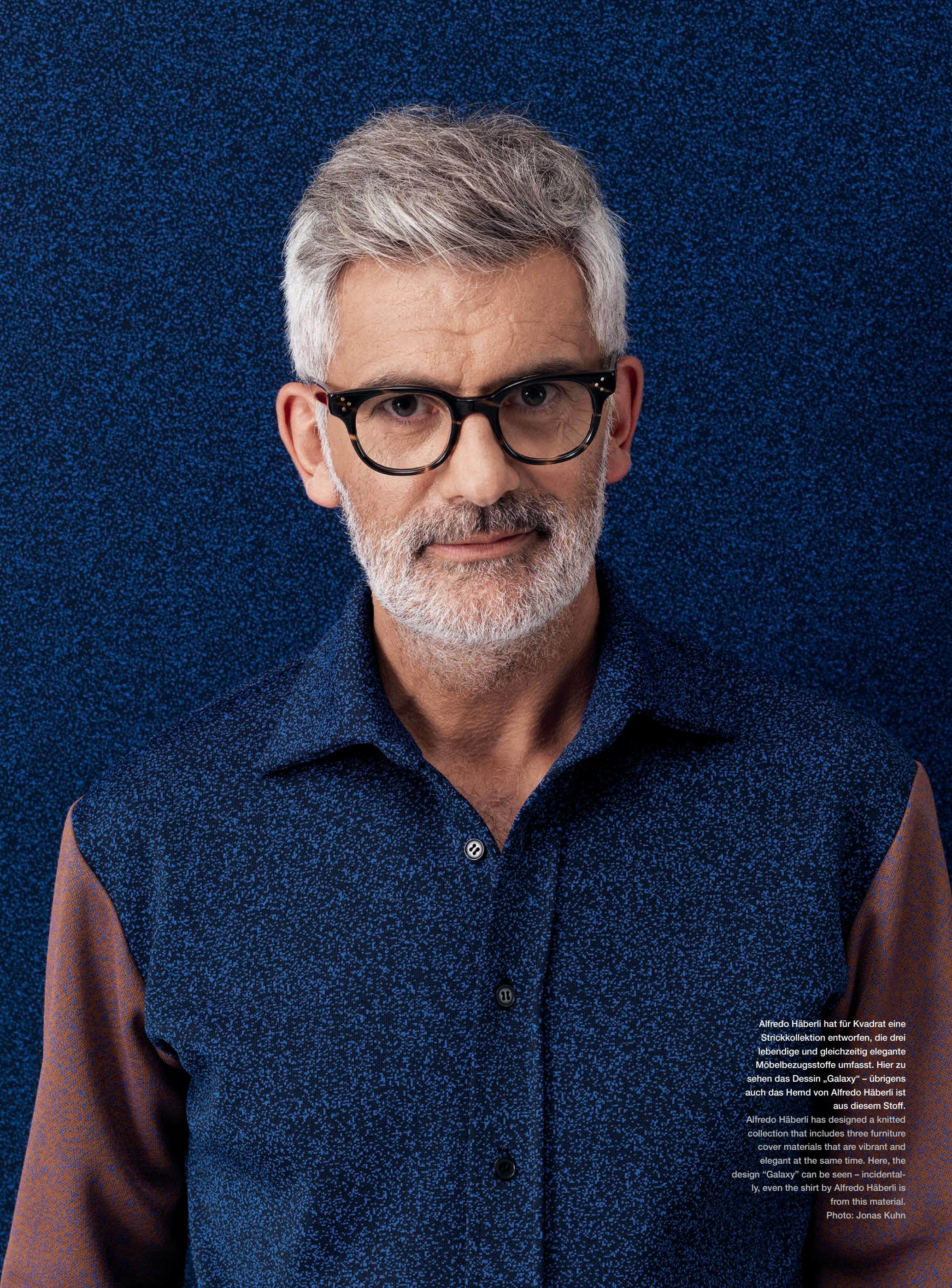
Alfredo Häberli hat für Kvadrat eine Strickkollektion entworfen, die drei lebendige und gleichzeitig elegante Möbelbezugsstoffe umfasst. Hier zu sehen das Dessin „Galaxy“ – übrigens auch das Hemd von Alfredo Häberli ist aus diesem Stoff. Alfredo Häberli has designed a knitted collection that includes three furniture cover materials that are vibrant and elegant at the same time. Here, the design „Galaxy“ can be seen – incidentally, even the shirt by Alfredo Häberli is from this material.