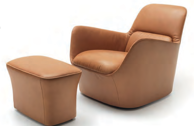
Sessel „DS 110“ für DeSede (2014). The „DS 110“ chair for DeSede.