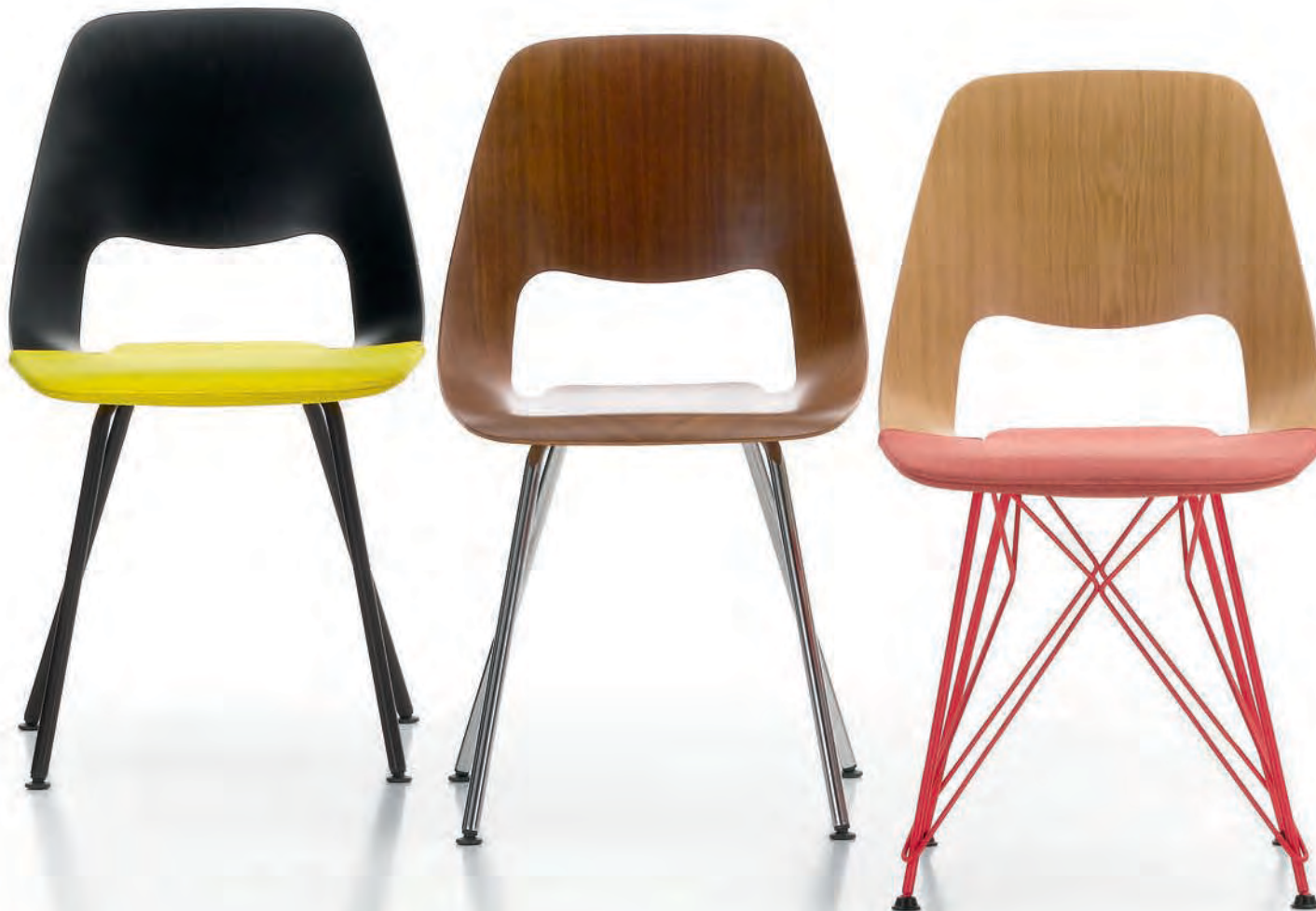
Stuhl „Jill“ für Vitra (2011). The “Jill” chair for Vitra.