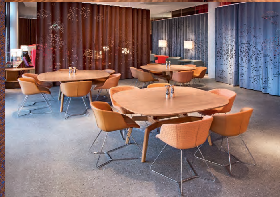
Das Hotel „25hours“ ist ein Häberli'sches Gesamtkunstwerk. Es wurde 2012 eröffnet und gilt als neuer urbaner Hotspot in Zürich. The „25hours“ hotel is a comprehensive work of art by Häberli. It was opened in 2012 and is regarded as a new urban hotspot in Zurich.