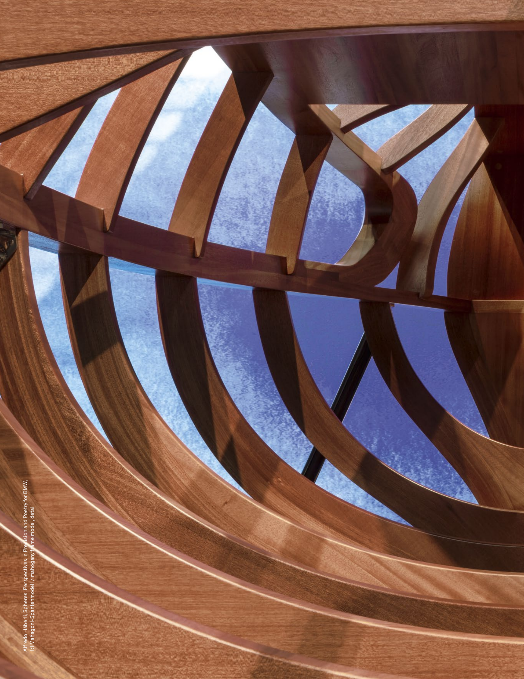
Alfredo Häberli, Spheres. Perspectives in Precision and Poetry for BMW. 1:1 Mahagoni-Spantenmodell / mahogany frame model, detail