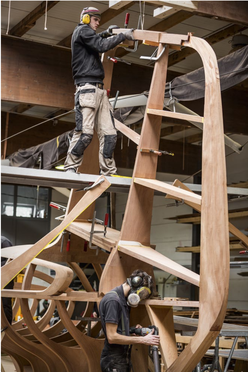
Spheres. Perspectives in Precision and Poetry for BMW, 1:1 Mahagoni-Spantenmodell/ mahogany frame model, making of