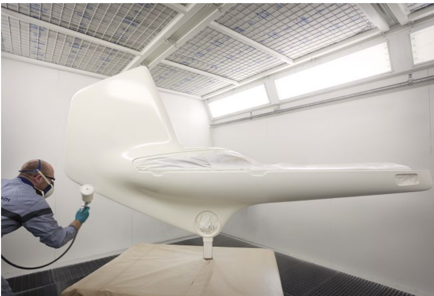
Spheres. Perspectives in Precision and Poetry for BMW, 1:3 model, making of