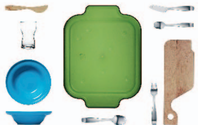
Kids' Stuff (2003) für Iittala