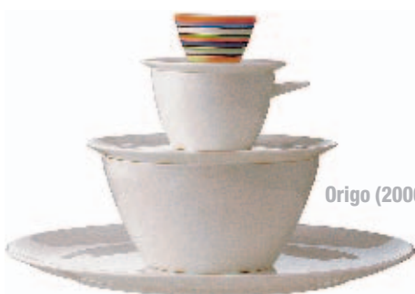
Origo (2000) für Iittala